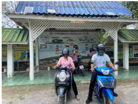
ภาพประกอบ กิจกรรมลำดับที่ ๑