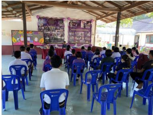
ภาพประกอบ กิจกรรมลำดับที่ ๕