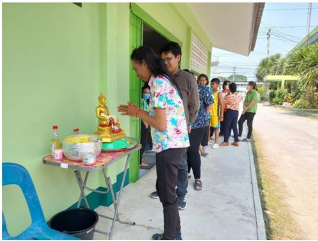
ภาพประกอบ กิจกรรมลำดับที่ ๔